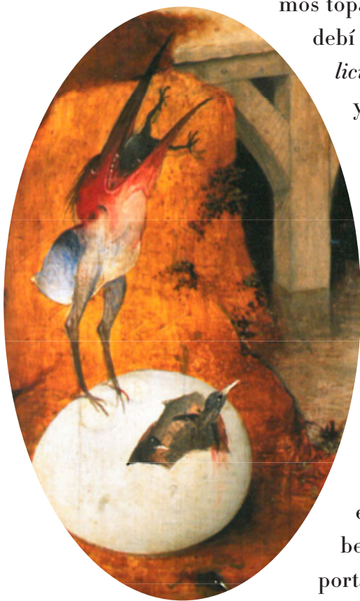
Detalle de Las tentaciones de san Antonio , panel izquierdo

que Hieronymus Bosch vio en su taller cuando decidió que había concluido su obra? ¿Qué tienen en común un escritor del siglo XXI y un pintor del siglo XV? Los dos proceden del mismo país, pero ¿se entenderían hoy si pudieran conversar? Intentemos leer la poesía mística de la poetisa medieval Hadewijch de Amberes o la obra del beato Jan van Ruusbroec, ambos anteriores al Bosco, aunque seguro que él los conoció, y comprobaremos con qué muro lingüístico podemos toparnos.