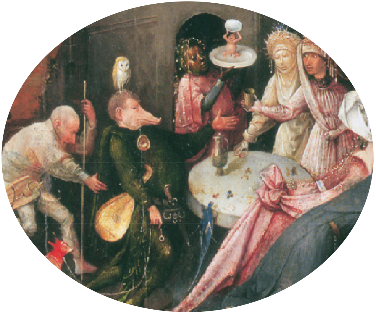
Detalle de Las tentaciones de san Antonio , panel central