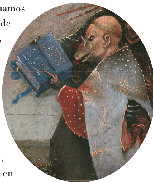
Detalle de Las tentaciones de san Antonio , panel central

Según Roland Barthes, no hay recuerdo que pueda reproducirse fielmente. Muchos son los elementos que obstaculizan el camino. Desfiguramos nuestros recuerdos, los dilatamos, mentimos inconscientemente, manipulamos lo que tomamos por memoria, describimos una verdad que nunca ha existido y continuamos viviendo con todo ello a cuestas. Era yo un joven de unos veintiún años, que aún no conocía España, cuando visité el Museo del Prado por primera vez. Cascos alemanes, ese fue el primer misterio con el que me enfrentó el país. Los soldados de Franco parecían alemanes en una obra dramática equivocada. Vagué por aquellas grandes salas del museo entre el extremo poderío del arte español y contemplé por primera vez las pinturas de Velázquez y Zurbarán, sobre quienes escribiría más adelante. Aunque en