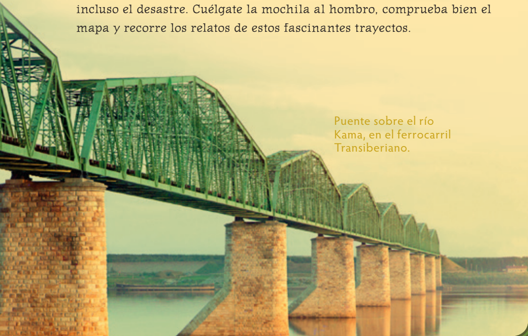
Puente sobre el río Kama, en el ferrocarril Transiberiano.

Estas diez grandes rutas, en épocas diferentes y por distintos lugares, han mostrado el camino hacia el descubrimiento, la riqueza e incluso el desastre. Cuélgate la mochila al hombro, comprueba bien el mapa y recorre los relatos de estos fascinantes trayectos.