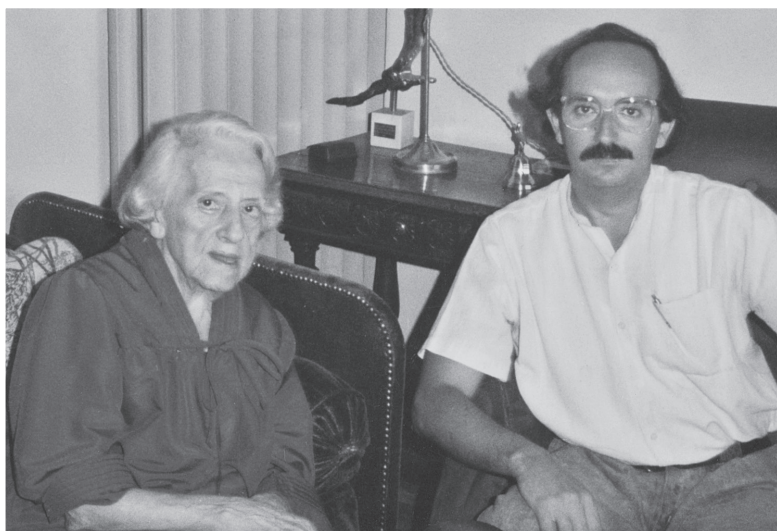
María Zambrano y Antonio Colinas en la casa de Madrid de la filósofa (1985)

Su obra, tan extensa y heterogénea como apasionante y vital, ha estado siempre (desde un profundo arraigo a sus raíces castellanas) abierta a otras culturas, por lo que esta posee un claro y profundo sentido de universalidad. La experiencia de vivir y la de escribir se funden en títulos como La simiente enterrada , Leyendo en las piedras , El sentido primero de la palabra poética , Memorias del estanque o Canciones para una música silente , por destacar algunos.