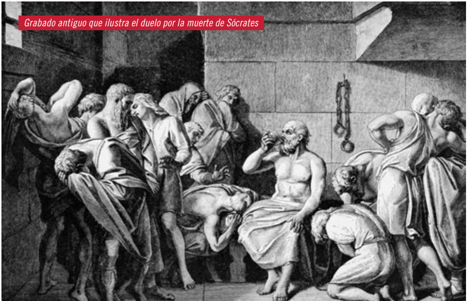
Grabado antiguo que ilustra el duelo por la muerte de Sócrates

El profesor Locard no fue el primero en aplicar los métodos científicos al estudio del crimen: ya en el 415 a. C., Hipócrates escribió un tratado sobre las características de las heridas mortales. También en la Antigua Grecia, en el 399 a. C., tras el suicidio de Sócrates con una copa de cicuta, aparecieron documentos sobre las particularidades de los venenos y sus efectos.